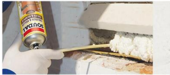
Figura 2. Espumas de poliuretano inyectada

- Paneles tipo sándwich: Están formados por dos láminas de acero galvanizado (a veces, se utilizan otros materiales rígidos como madera) con un núcleo de espuma rígida de poliuretano o de poliestireno expandido entre esas dos capas. En el momento de la fabricación, el material aislante se expande adhiriéndose a las láminas, por lo que se convierten en un solo producto. La durabilidad de los paneles sándwich hace que se utilicen habitualmente en construcción como aislantes en: techos, cubiertas, y muros divisorios.