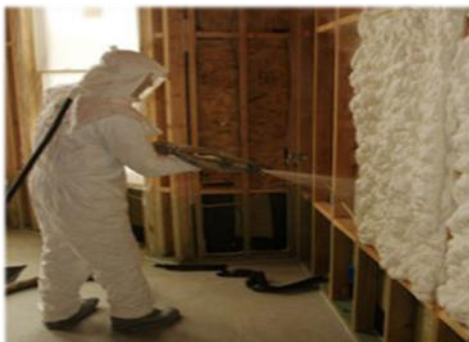
Figura 1. Espumas de poliuretano proyectadas