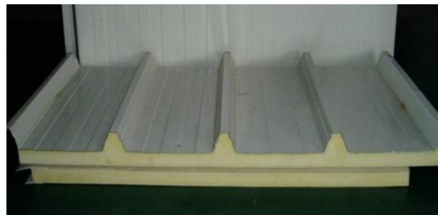
Figura 3. Paneles tipo sándwich

- Paneles tipo sándwich: Están formados por dos láminas de acero galvanizado (a veces, se utilizan otros materiales rígidos como madera) con un núcleo de espuma rígida de poliuretano o de poliestireno expandido entre esas dos capas. En el momento de la fabricación, el material aislante se expande adhiriéndose a las láminas, por lo que se convierten en un solo producto. La durabilidad de los paneles sándwich hace que se utilicen habitualmente en construcción como aislantes en: techos, cubiertas, y muros divisorios.